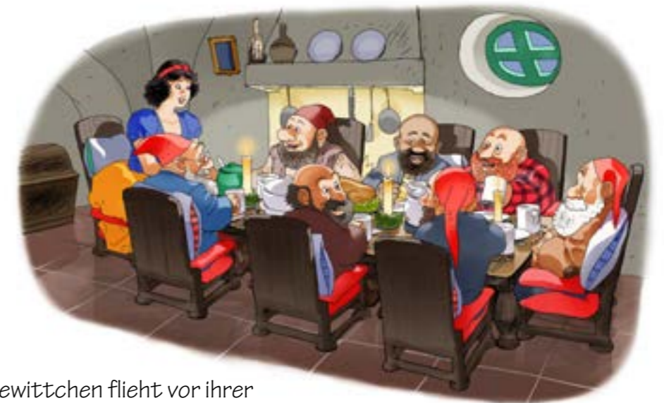
Schneewittchen flieht vor ihrer bösen Stiefmutter. Sie darf dann bei den sieben Zwergen wohnen.