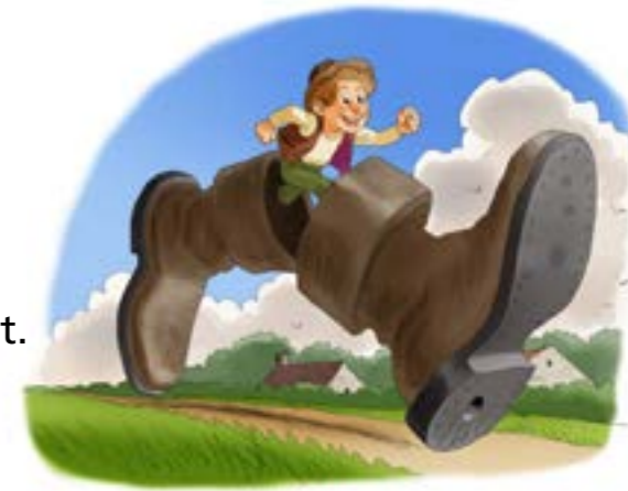
Der kleine Däumling klaut die Siebenmeilenstiefel von dem schlafenden Riesen.

Sie sind lieb und helfen anderen Menschen.